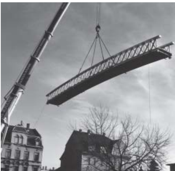
Neubau der Fußgängerbrücke „Goethesteig“