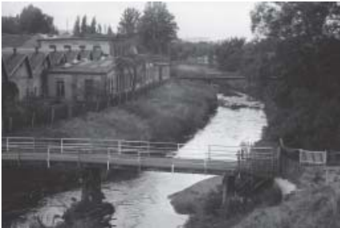
Erneuerung der Fußgängerbrücke am Pegel in Gößnitz, 1982

Seit dem 8. Dezember 2005 ruht das neue elegante Brückenbauwerk auf seinen neu geschaffenen Widerlagern und wurde am 21.12.2005 der Nutzung übergeben.